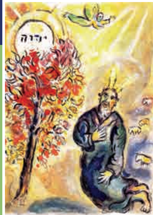
© Marc Chagall „Die Gotteserscheinung im brennenden Dornbusch. Exoduszyklus“ 1966, VG Bild-Kunst 2014

12. Juni bis 21. Juli 2015 Christuskirche Warendorf